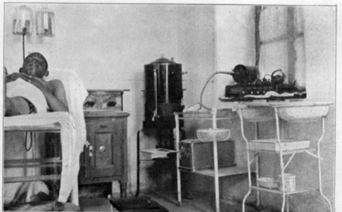
غریبانه ضمه خانه سنده عملیاتخانه

وظیفه قافیه آنجاق تشید آهنگ اولدینی تخطر ایدیلنجه ، قافیه قولاق ایچوندر ، جمله سی امر بیله قوتی آلیر . معلم ناجی نه دیرسه دیسون - احتراز ، اتخاذ ، اعتراض - کله لری مفتی در و باعکس جبل معناسنه اولان - طاغ - کله سیله جرحه معناسنه اولان - داغ - کله سی آزارلنده کی مسافه آهنگدن ناشی تقیه ایدیلنجه : « طاغ » ده غینك