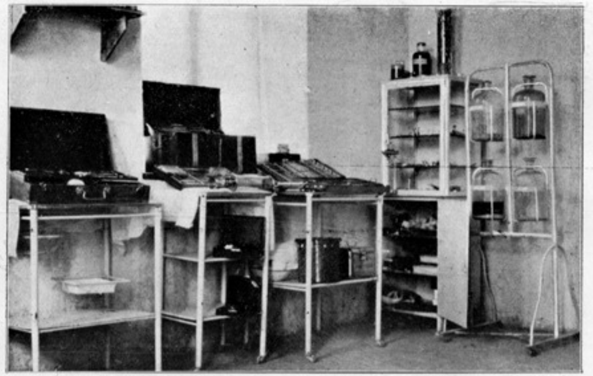
غریبانه همدل امر ضمه خانه سنده عملیاتخانهك بر قسمی

توزان مجاشیدن حصوله كان آهنگ نزار ایله قناعت ایده لرلردی؟ بزغالبا نعمت عروضك قدری بیله مه . یوز. قافیه بحثنده ده سندن آری بیورم : فکرجه قافیه نه عزت هولو قدر زنکین ، نه شاعر اشرف - زوالی مرحوم اشرف ، - قدر فقیر اولمالی . خیر الامور اوسطها : اورتا حالی قافیه لری ترجیح ایده رم . قافیه نك اك بو یوك نقرصه سی آنجاق قافیه اولتی ایچون وارد اولماسی درکه مصراعك قویروغنده عضو زائد کیبی، فس نوستنده پوسکول کیبی قالیر . اونونما که هر قافیه بر مصراعك جزئی اولادن اول بر جمله نك جزئی در ؛ وظیفه اصلی سی جمله ده در . مصراع داخلنده آنجاق بر وظیفه اضافیه ایفا ایدر ... قافیه نه نهایتنده کجکجه برابر مصراعك نه قویروغی . نه آیانچی در ؛ بلکه سمع ودهانی دینه بیلیر . بو جهنله مقتضای آهنگ و تناسبدرکه واضح و طنان اولسونلر ... اسک زمانده منهای مصاریمزده «ردیف» لر واردی ؛ جوق شکر ، بونلردن نظمیزی همان کاملا قورناردق فقط کوش اسفله ایشید بیورم . حال فعلی فعل ایله صفتی صفتله ، اداتی اداتله تقیه ایتمکده دوام ایدیوروز ... بو پک قولایدر . حال بوکه . بیک کره سویلندی ، صنعت صعوبتی ایجاب ایدر . کسر اطراد ایچون مثلا بر فعلی بر صفت ، بر اسم ویا برادات ایله تقیه انسددر . ایشته باقی ، شوقطعه مده قافیه لر پک فنا :