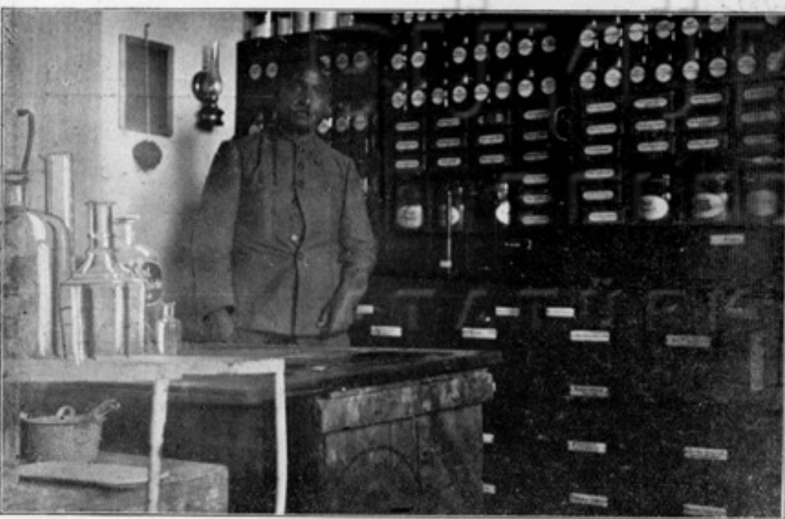
غریبانه ضمه خانه سنك اجراهانه داره سی

اوقدر قورلوتوفلامشکرکه لهجه ائنه توکنمش! ... بوندن باشقا بزم مفلس الدماغ اولدیفغیزی بی پروا اعلان ایدن او خاطر ناشناس معقبلمنه قارشی بز آرتیق ادباندن اولتی ادعاسنده بولوناییله جکمیدک ؟ هیچ اولمازسه کور کورلیمزدن استفاده ایتک ایچون بزله « ادبا معاونی » صفتیله اولسون « عالم قلمده بر کوشه جکیز کوسترمک ایسته مینلری تحسینه قاتیشماش بر حدناشناسلنی اولمازمیدی ؟